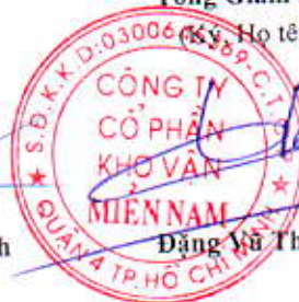
Đặng Vũ Thành